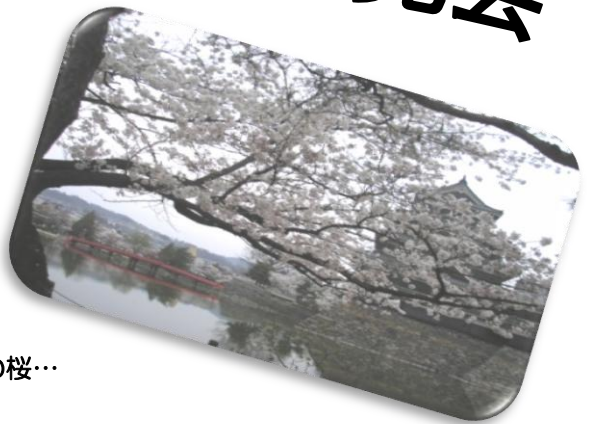
前日お城は満開の桜…

4月11日土曜日、前日から雨で大手公民館内での開催になりましたが、中央地区のお花見会が盛大に開催されました。例年は、満開の桜の下松本城でにぎやかに行われます。観光客や、他の宴会の人と一緒に楽しく宴会、踊りの輪が広がります。