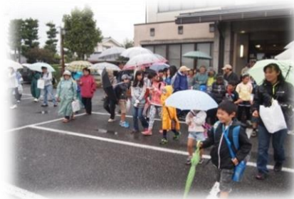
新村地区 新の里ウォークラリー