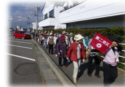
第二地区 ウォーキング & 芸術館の裏側探訪