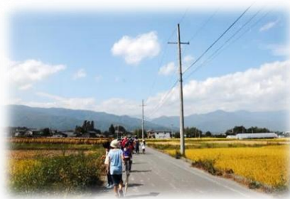
今井地区 今井を歩こう