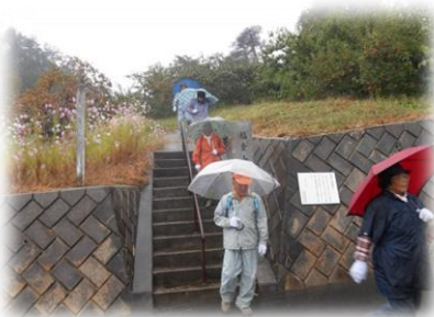
岡田地区 観音堂めぐりウォーキング