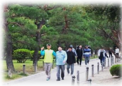
中央地区 世代間交流歩こう会