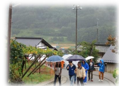
入山辺地区 入コン(ウォーキングとぶどう狩り)

他の地区福祉ひろばでも いろんなウォーキング イベントが行われていま す。ぜひご参加ください。