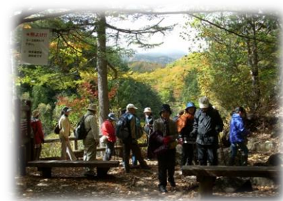
白板地区 ひろばウォーキング 「紅葉の乗鞍国民休暇村へ」