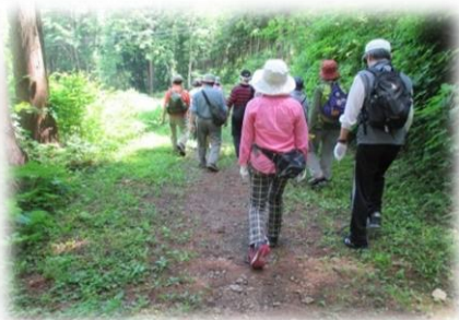
安原地区 塩の道ウォーキング

地区の福祉ひろばではいろんなウォーキングイベントがありました。一部ご紹介します。