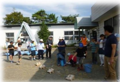
城東地区 親子ウォーキング