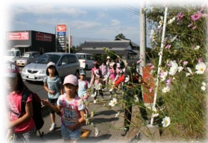
寿地区 親子ウォーキング大会